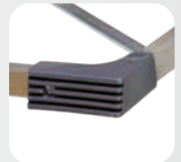
Füßen - Stützteil