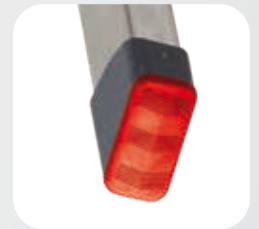
Füßen - Aufstiegsteil